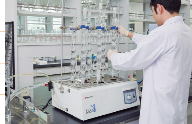
研究開発型企業として、新規素材の開発から機能性素材の有効性・安全性の検証までをスピーディーに行っている